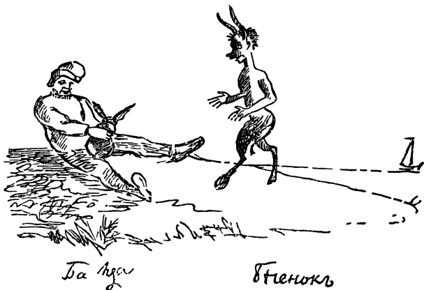
БАЛДА И БЕСЕНОК. Рисунок А. С. Пушкина.

Мне оброк по самой моей смерти; Лучшего б не надобно дохода, Да есть на них недоимки за три года. Как наешься ты своей полбы, Собери-ка с чертей оброк мне полный». Балда, с попом понапрасну не споря, Пошел, сел у берега моря; Там он стал веревку крутить Да конец ее в море мочить. Вот из моря вылез старый Бес: «Зачем ты, Балда, к нам залез?» — «Да вот веревкой хочу море мѳрщить, Да вас, проклятое племя, корчить». Беса старого взяла тут унылость. «Скажи, за что такая немилость?» — «Как за что? Вы не плотите оброка,