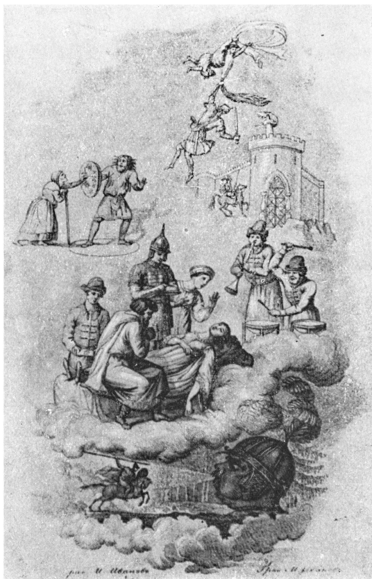
ФРОНТИСПИС ПЕРВОГО ИЗДАНИЯ ПОЭМЫ «РУСЛАН И ЛЮДМИЛА». 1820 г.