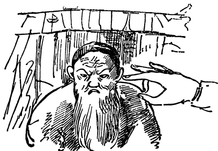
ПОП ПОД ЩЕЛЧКОМ. Рисунок А. С. Пушкина.

Понапружился, Приподнял кобылу, два шага шагнул, На третьем упал, ножки протянул. А Балда ему: «Глупый ты бес, Куда ж ты за нами полез? И руками-то снести не смог, А я, смотри, снесу промеж ног». Сел Балда на кобылку верхом, Да версту проскакал, так что пыль столбом. Испугался бесенок и к деду Пошел рассказывать про такую победу. Делать нечего — черти собрали оброк Да на Балду взвалили мешок. Идет Балда, побрякивает, А поп, завидя Балду, вскакивает, За попадью прячется, Со страху корячится. Балда его тут отыскал,